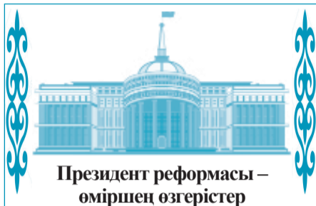
Президент реформасы – өміршең өзгерістер

Қазақстан бүгінде жаңа даму жолына түсті. Қазір әлемде болып жатқан күрделі өзгерістер қоғамдағы мәселелерге жаңа көзқараспен қарауды талап етуде. Осы орайда Мемлекет басшысы